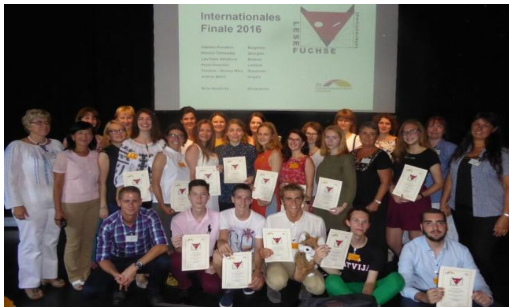
Die internationalen Lesefüchse