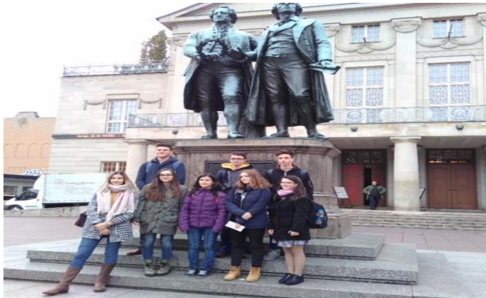
Die Lenauschüler vor dem Goethe-Schillerdenkmal in Weimar