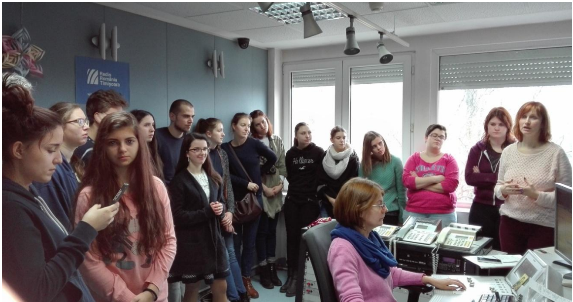
Zu Besuch im Studio von Radio Temeswar

Es wurde oft gesagt, dass Temeswar nicht nur eine Stadt ist, sondern eine Lebensweise . Deswegen finde ich, dass das Eintauchen Jugendlicher, welche sich mit Zukunft und Werten auseinandersetzen, in diesen für den durchschnittlichen Touristen ziemlich unbekannten Kulturraum eine besondere Erfahrung ist.