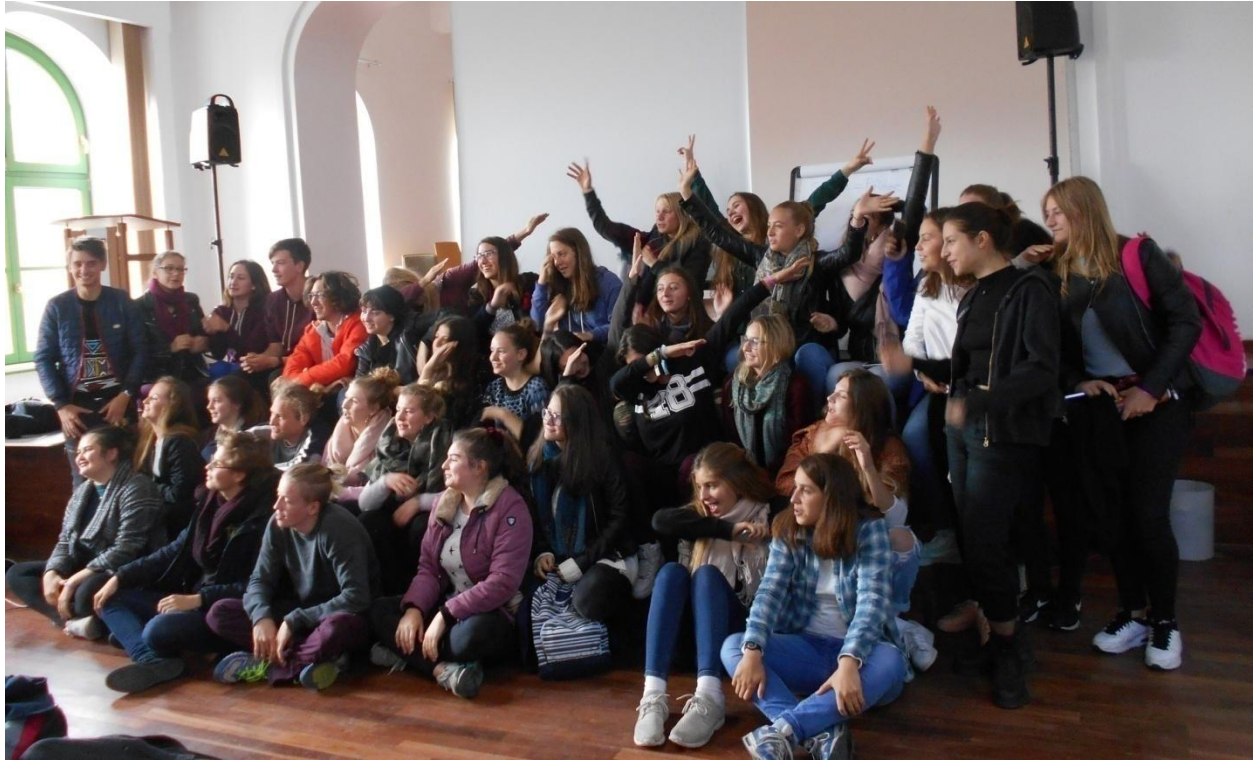
Gruppenfoto nach einer gemeinsamen Woche