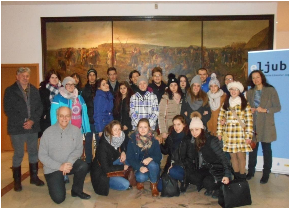
Gruppenfoto im Adam-Müller- Guttenbrunn- Haus