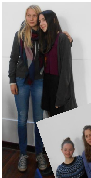
Freundinnen und ....