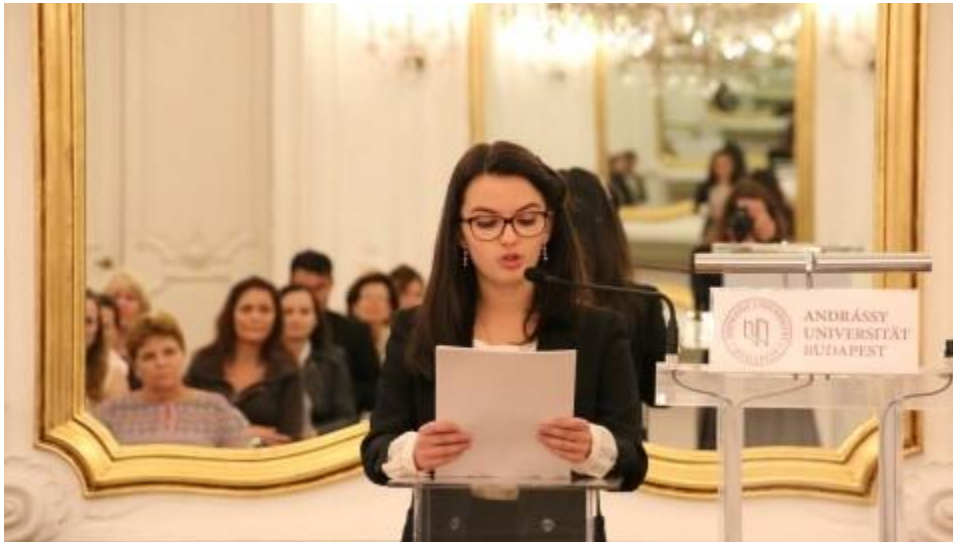
Die Siegerin liest aus ihrem Essay.