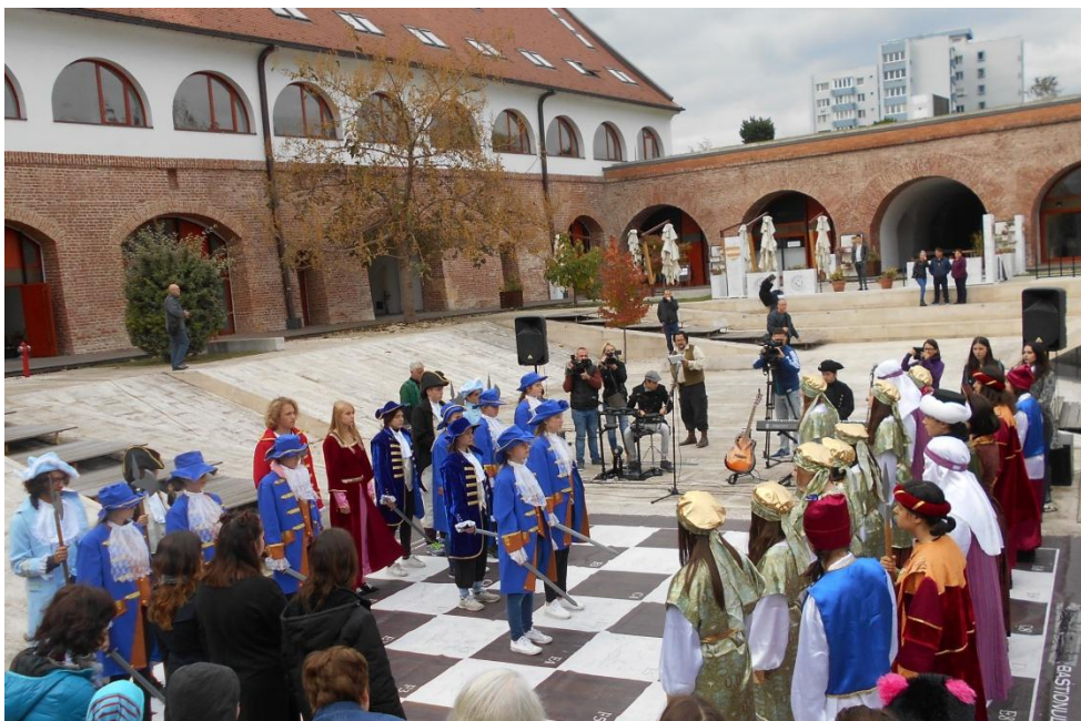
Momente der „Schlacht“ um die Befreiung Temeswars von der türkischen Herrschaft

Und plötzlich erreicht uns eine E-Mail von einem der Leiter des Gymnasiums „Campus Muristalden“ aus Bern, der an einen „möglichen Austausch“ mit der Lenauschule gedacht hat. Auch erkundigte er sich, ob wir denn Interesse an einem Austausch hätten.