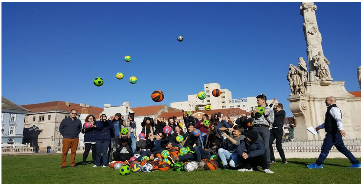
Ballspiel am Domplatz