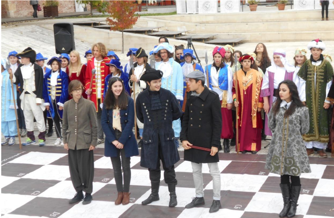
Die Darsteller freuen sich über den Applaus