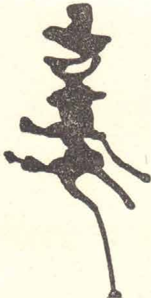
Herbert Wetzler: Schwarzkünstler

Das Bild „Meeresgrund“ überrascht durch die harmonische Gestaltung heller Braun-, Blau- und Rottöne im Hintergrund, wobei der schwarze Fleck, der sich