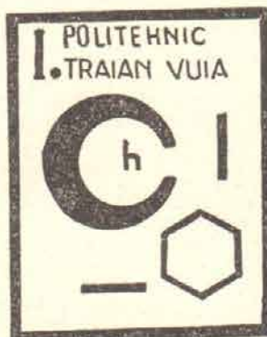
Das Abzeichen der Studenten der Chemie fakultät

pe Studenten auf dem Gebiet der Bekämpfung der Wasserverschmutzung. Diese Spezialisierungsgruppe ist die einzige dieser Art in ganz Rumänien.