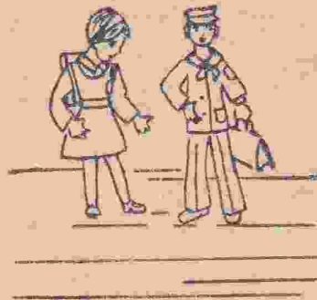
Zeichnung: Roxana Lăpușan, VIII.

Die Uniform ist das Sinnbild des Schülers. Sie spricht eine eigene Sprache: Eine saubere, ordentliche